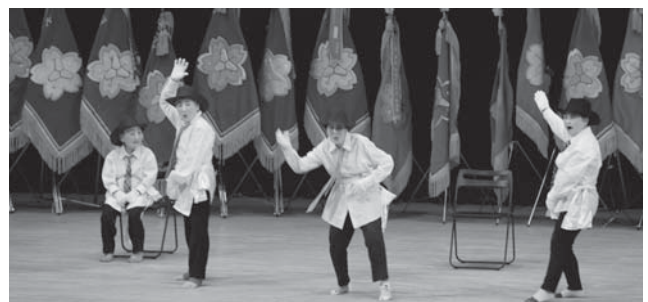
山内唄おう踊ろう会