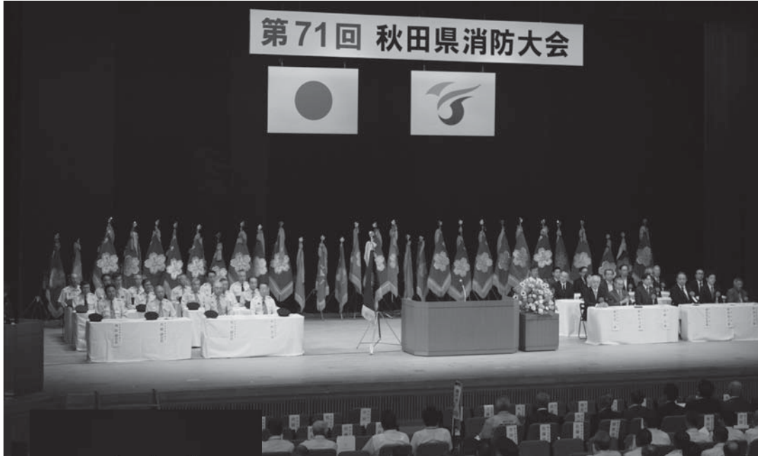
第71回 秋田県消防大会